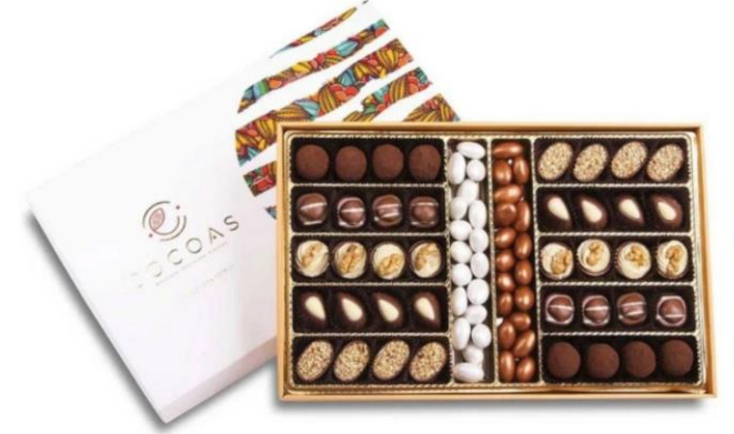
Bronz Badem Spesiyal Çikolata 1000 Gr kutuda (net 612 gr)