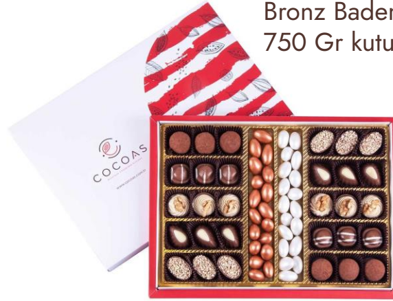
Bronz Badem Spesiyal Çikolata 750 Gr kutuda (net 504 gr)