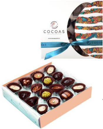
Indigo Lale Spesiyal Çikolata 500 Gr kutuda (net 172 gr)