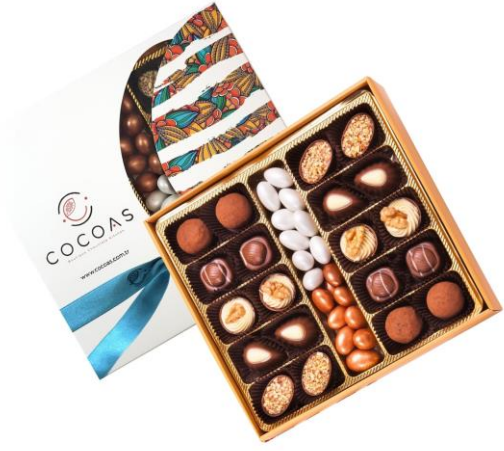
Bronz Badem Spesiyal Çikolata 500 Gr kutuda (net 306 gr)