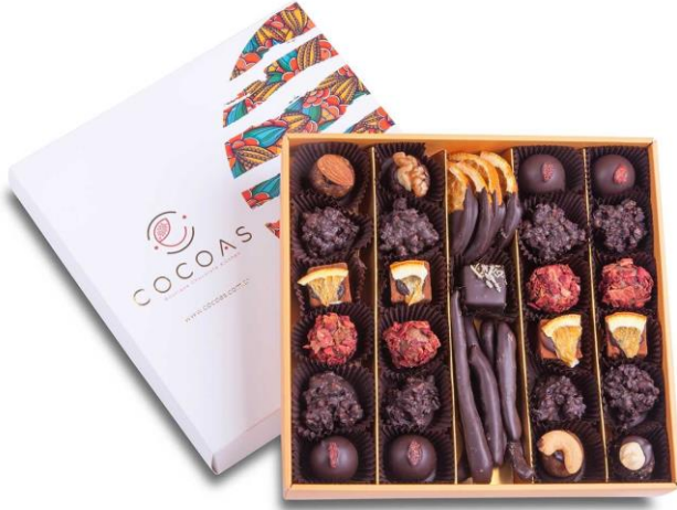
Harmoni Artisan Çikolata 500 Gr kutuda (net 314 gr)